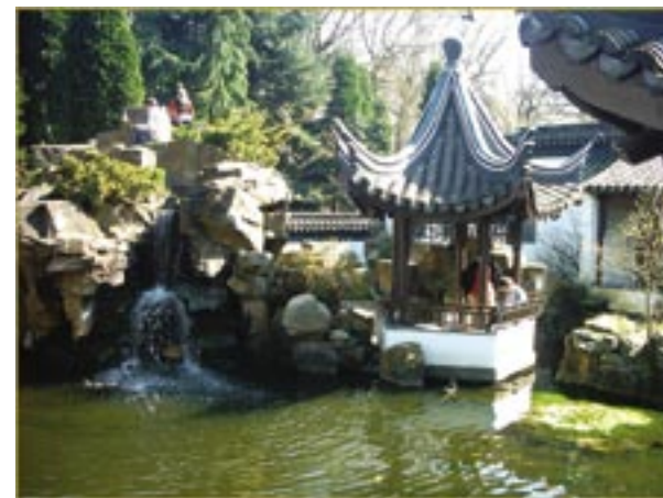
友谊的象征：1990年在波鸿大学建校25周年之际，同济大学捐赠的中国园林“潜园”在波鸿落成。 图为潜园一角