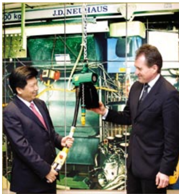
图为中华人民共和国驻德国大使马灿荣参观维滕市历史悠久的纽豪斯集团公司。集团董事长威尔福利德·纽豪斯·加利德，同时也是德国中国工商会(CIHD)副会长，向马灿荣大使介绍气压起重机的技术特性。

大约二万五千家企业是波鸿工商会会员，其中不仅有大型的世界知名企业如诺基亚，欧宝和英国BP石油公司等，也有众多中型专业机械制造企业。在传统企业之外，近年来出现了很多新兴技术服务企